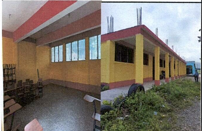
Foto 4: Se esta realizando la Pintura general del establecimiento

Observación: Si es necesario se pueden agregar hojas adicionales y actualizar el número de hojas.